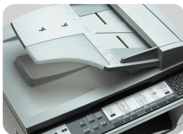
Doplňkový jednorůchodový podavač