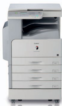
imageRUNNER 2400 s volitelnými kazetami na papír

Chápeme, že podniky sice čelí obecným problémům, ale každý podnik je jedinečný. To je důvod, proč řada kompaktních produktů Canon imageRUNNER zahrnuje celou škálu modulárních multifunkčních zařízení A4 a A3, což vám umožňuje najít řešení, které nejlépe vyhovuje vašim potřebám.