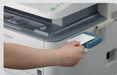
Volitelné ověřování pomocí karet k uniFLOW

uniFLOW MyPrintAnywhere 1 – Dokumenty si lze vyzvednout v nejpohodlnějším místě v síti – bez ohledu na to, kam byly původně odeslány.