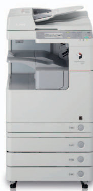
imageRUNNER 2520i s volitelnými kazetami na papír a DADF