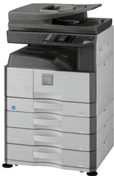
Vyobrazený model AR-6023N

Když potřebujete sdílené síťové zařízení, sáhněte po AR-6020N s rychlostí 20 stran/min. nebo AR-6023N s rychlostí 23 stran/min. Pokud si vystačíte s personálním multifunkčním systémem, můžete ušetřit a vybrat si AR-6020D, AR-6020 nebo AR-6023D.