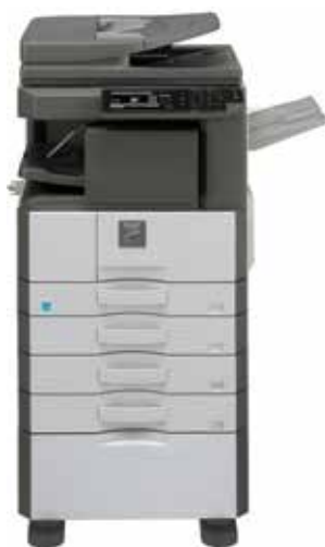
Vyobrazený model MX-M316N

SÍŤOVÉ A3 ČERNOBÍLÉ FLEXIBILNÍ MULTIFUNKČNÍ ZAŘÍZENÍ